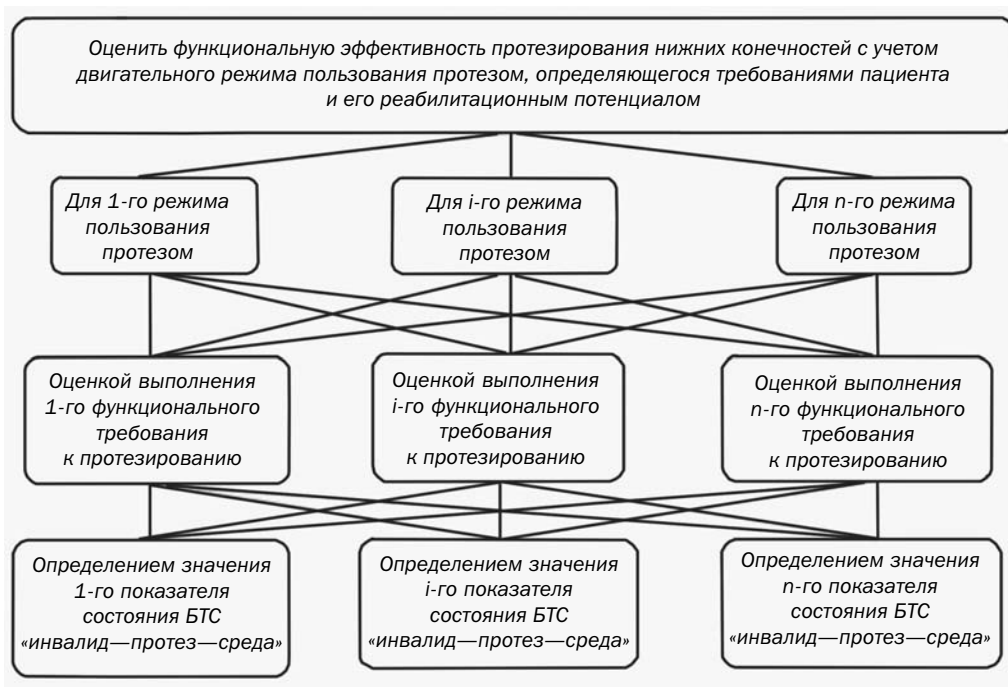
Рис. 3 Структура модели аналитического иерархического процесса оценки функциональной эффективности протезирования нижней конечности

3. Система показателей эффективности протезирования и ортезирования пациентов с патологией нижних конечностей должна базироваться не на нормализации биомеханических параметров локомоций пациента с ПОИ по сравнению с состоянием без него (как это часто делается в данной области деятельности), а на определении уровня выполнения медико-биомеханических задач назначения ПОИ пациенту, которые определяются наличествующей у него патологией и дви-