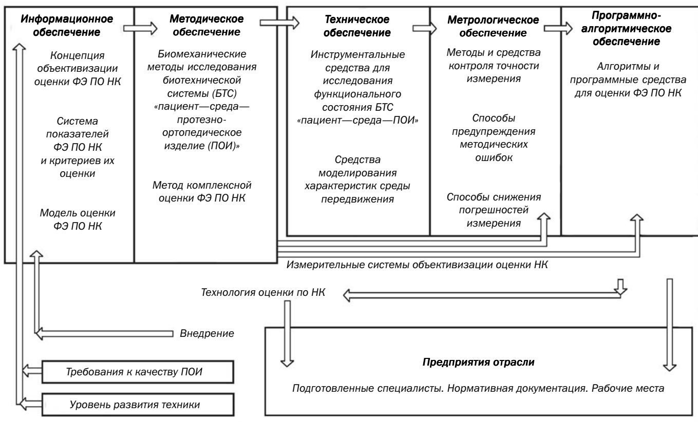
Рис. 1 Этапы разработки технологии объективизации оценки результатов протезирования и ортезирования пациентов с патологией нижних конечностей

Приближение интегральных параметров локомоций к среднестатистической норме не всегда является пока-