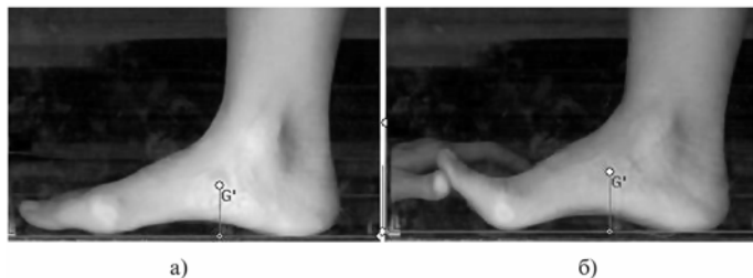
Рис. 1. Рычажный тест на примере изображения правой стопы в медиальной плоскости: а) исходное положение – стоя с опорой на всю стопу; б) стоя с опорой на стопу при выполнении рычажного теста

При проведении компьютерной плантоподографии мы исследовали именно те биомеханические тесты, которые нашли наибольшее практическое применение для оценки функционального состояния стоп при клиническом осмотре пациентов, а именно: для оценки способности стопы повышать ее сводчатость при натяжении подошвенного апоневроза (при пассивном тыльном сгибании большого пальца стопы) – рычажный тест первого пальца стопы (иначе – тест Джека, тест лебедки) (рис. 1); для оценки функционального состояния мышечно-связочного аппарата стопы и голени – тест Штритера (рис. 2) [3].